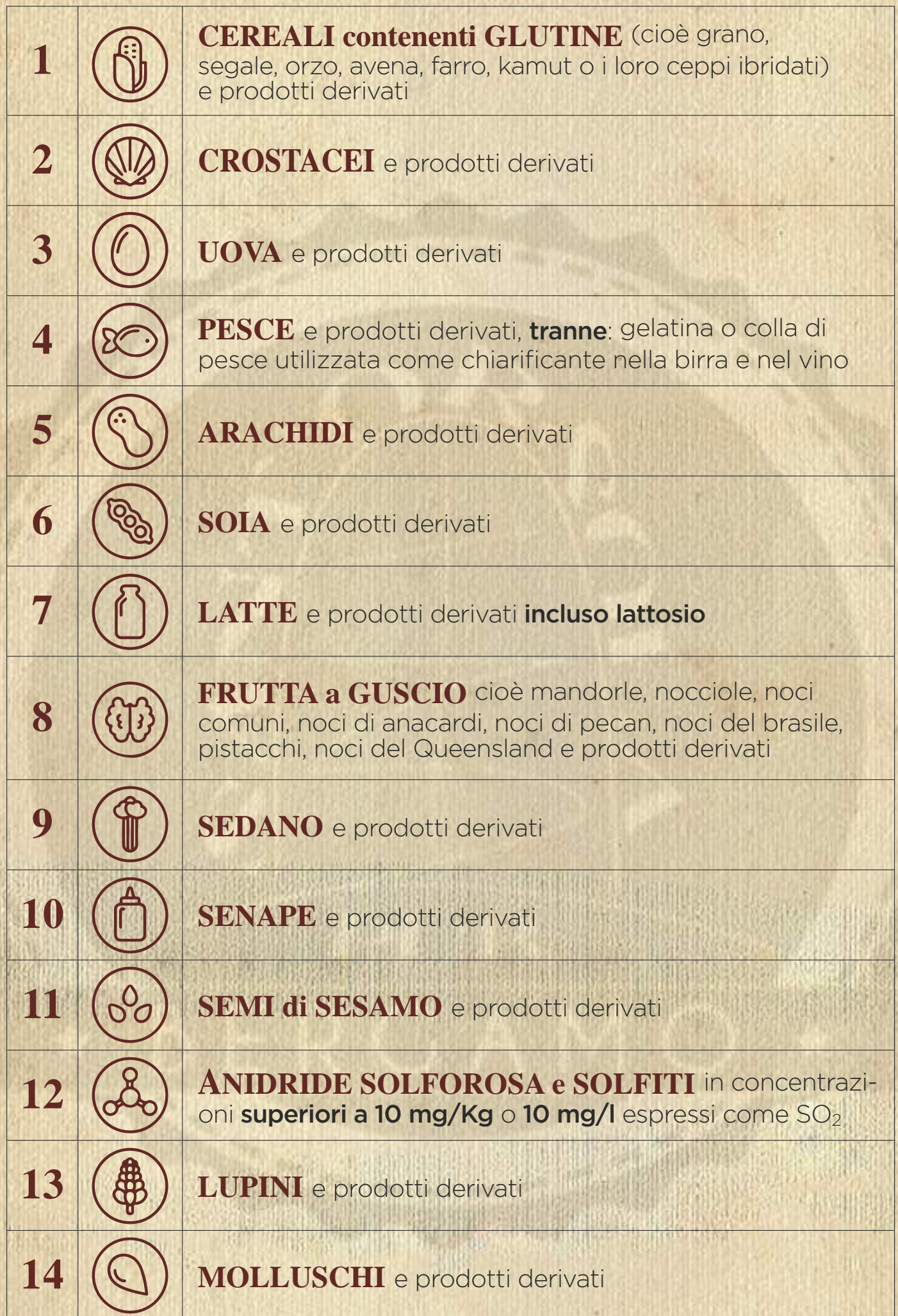
Tabella allergeni (Reg. 1169/2011)

NB: A tutela di intolleranze o allergie importanti: elaborazione piatti e panini viene effettuata nel medesimo luogo indi per cui non escludiamo eventuali contaminazioni.