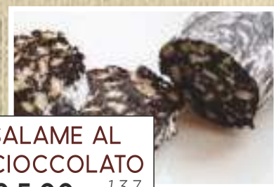
SALAME AL CIOCCOLATO € 5,00 1,3,7