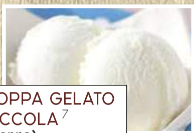
COPPA GELATO PICCOLA 7 (panna) € 3,50