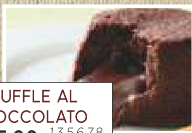
SOUFFLE AL CIOCCOLATO € 5,00 1,3,5,6,7,8