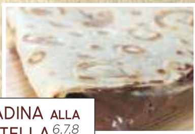
PIADINA ALLA NUTELLA 6,7,8 € 6,00